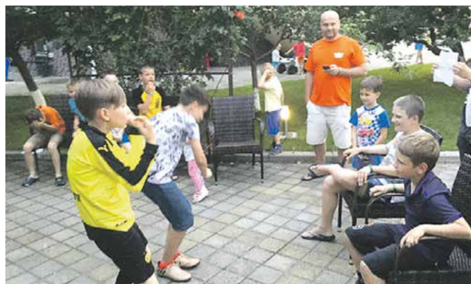
Скорость и сообразительность