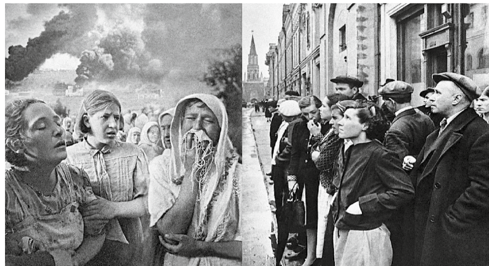
За первые 8 часов войны Советская армия потеряла 1 200 самолетов, из них более 900 были уничтожены еще на земле. На фото слева: 23 июня 1941 года в Киеве, район Грушки.