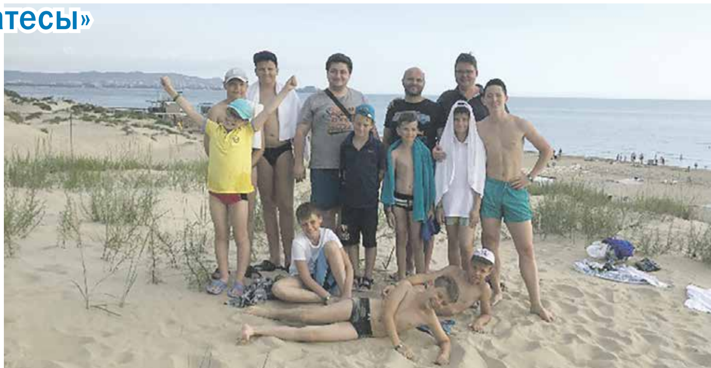
На море или на занятия?