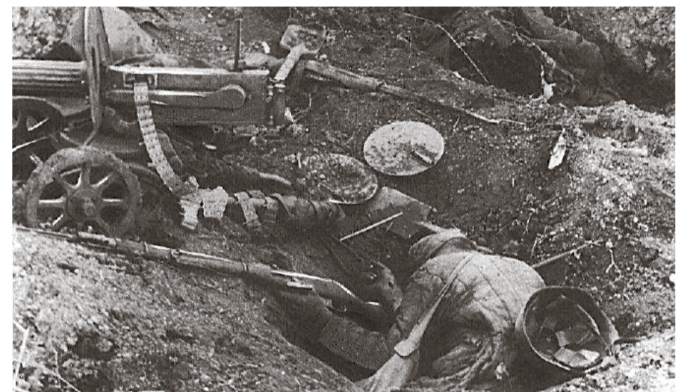
1944 год. Так выглядела территория Лигово после освобождения. Очень много погибших с нашей стороны (окоп и двое убитых)