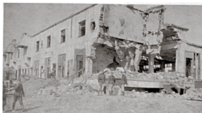
Здание подстанции, где находился немецкий штаб после артиллерийского обстрела нашими орудиями. 1943 год

сюда предполагал он нанести удар – прорыв в Ленинград.