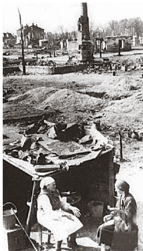
Весна 1944 года. Первые беженцы возвращаются на места бывшего проживания.

В районе Урицка враг сосредоточил наиболее крупные силы, ведь именно от-