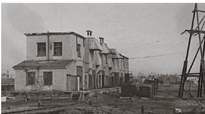
Здание подстанции. Оно существовало до войны, во время войны и сейчас. Во время войны в этом здании располагался немецкий штаб (находится перед КАС Лигово – сейчас синего цвета).