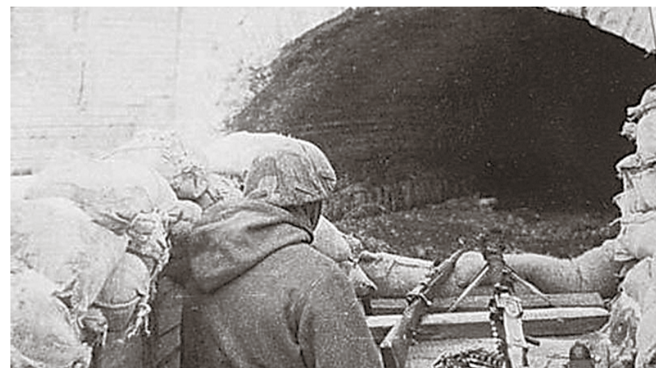
Тоннель в Лигово. Фрагмент боя