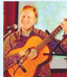
ПЕВЕЦ ВИКТОР ШКРЕДОВ