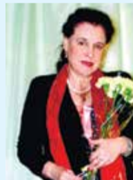
ПОЭТЕССА ГАЛИНА ТЫЧИНА