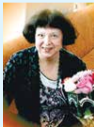
ПОЭТЕССА НАДЕЖДА ОРАЕВСКАЯ