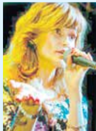
ПЕВИЦА АЛЕНА СУРИК