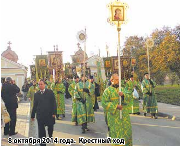
8 октября 2014 года. Крестный ход

Но только тридцать лет спустя пустынь стала самостоятельным монастырем. К этому времени здесь выдвинулся красивый пятиглавый каменный собор Святой Живоначальной Троицы, возведенный по проекту П.А. Трезини, были построены кирпичные кельи. Следил за ходом работ другой знаменитый архитектор – Растрелли. История монастыря связана еще со многими выдающимися именами. Около 1773 года в пустынь поступил шестнадцатилетним послушником будущий преподобный Герман Аляскинский, который пробыл здесь пять лет. А расцвет пустыни связывают с приходом в настоятели в 1834 году архимандрита Игнатия (Брянчанинова). Святитель был славен не только своими трудами, посвященными «умному деланию», аскезе и молитве, – но и вполне земным, хозяйственным «деланием»: в период его управления были отреставрированы Троицкий собор, монашеские кельи, возведены церкви Покрова Пресвятой Богородицы и святителя Григория Богослова, налажено хозяйство. Монастырским