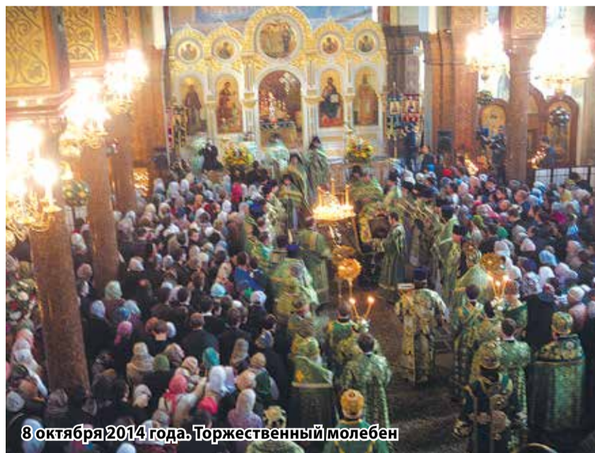
8 октября 2014 года. Торжественный молебен

8 октября в 9.00 от площади у исторического вокзала станции Сергиево (пос. Володарский) до Троице-Сергиевой Приморской пустыни отправился крестный ход. В 10.00 начались богослужения во всех храмах обители. После по традиции Лавры преподобного Сергея все участники празднования собрались на монастырской площади, где прошли торжественный общий молебен и другие праздничные мероприятия: церемония награждения, концерт духовной музыки и показ документального фильма «Сергиев Петербург» режиссера Алены Поликовской, снятого специально для праздника. Местом действия кинокартины выступили Стрельна и Петербург.