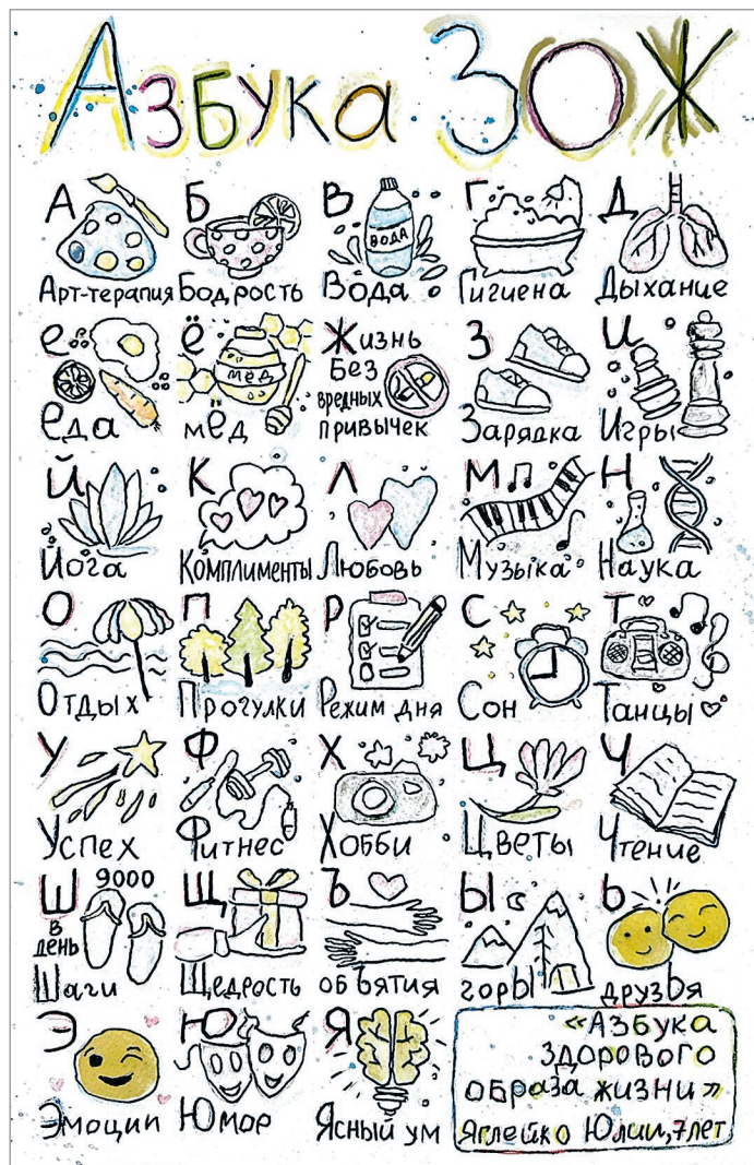
1-е место – Юлия Яглейко. «Я здоровым быть хочу»

И еще один конкурс завершился, он был посвящен Дню отца, который мы тоже отмечаем осенью. Этот праздник особенно ва-