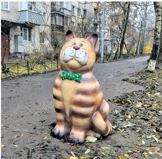
«А у нас во дворе новый кот»

Фигура кота, много лет охранявшего двор дома № 36, корпус 2 по улице Пограничника Гарькавого, отправилась на покой, уступив место новому котику. Теперь здесь расположился яркий, веселый и невероятно добрый мурлыка. Просьба отнестись к новому обитателю двора бережно, не разрешайте детям рисовать на нем или отрывать детали. Тогда котик сможет радовать вас своей теплотой и уютом еще многие годы.