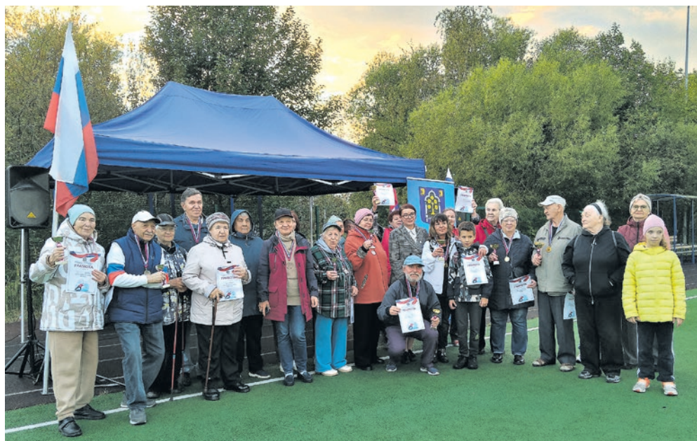
Среди участников турнира по бочке, который прошел в сентябре, была большая команда от общества инвалидов МО Константиновское